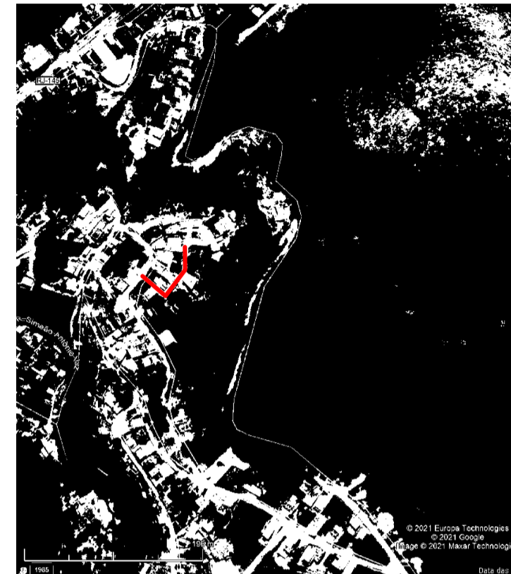
TRECHO I S/Esc.