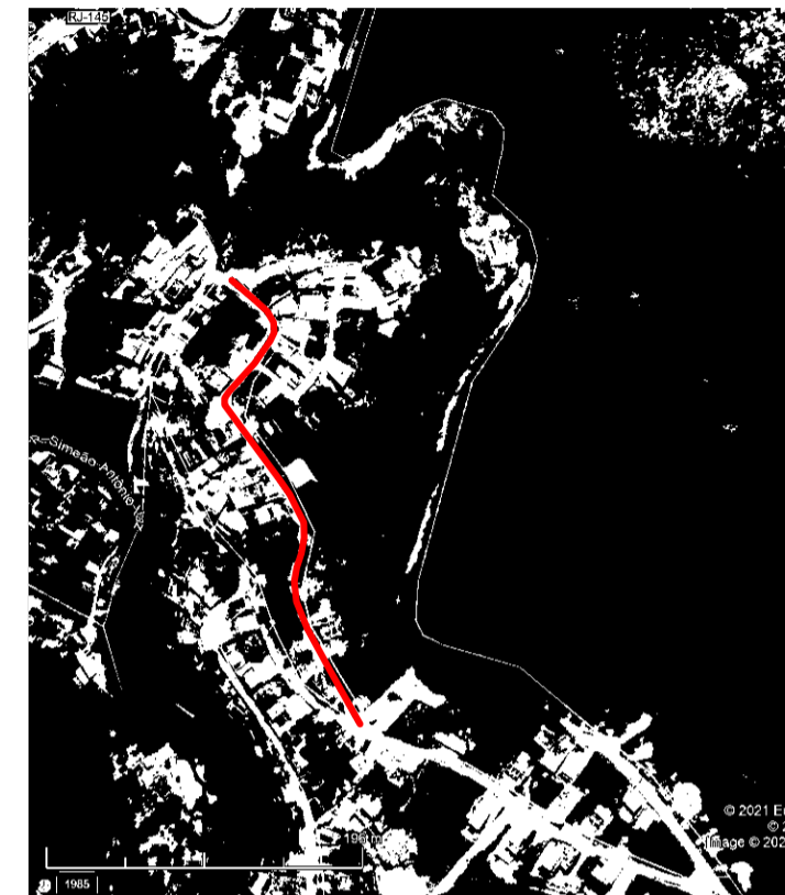
TRECHO II S/Esc.